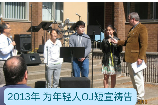
2013年 为年轻人OJ短宣祷告