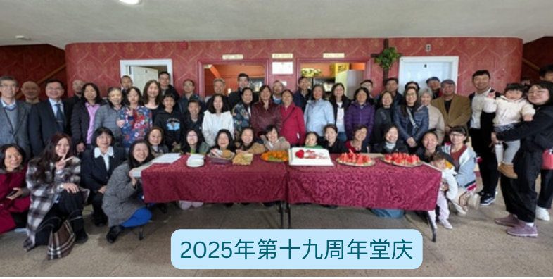
2025年第十九周年堂庆