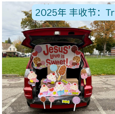
2025年 丰收节: Truck-or-Treat福音外展