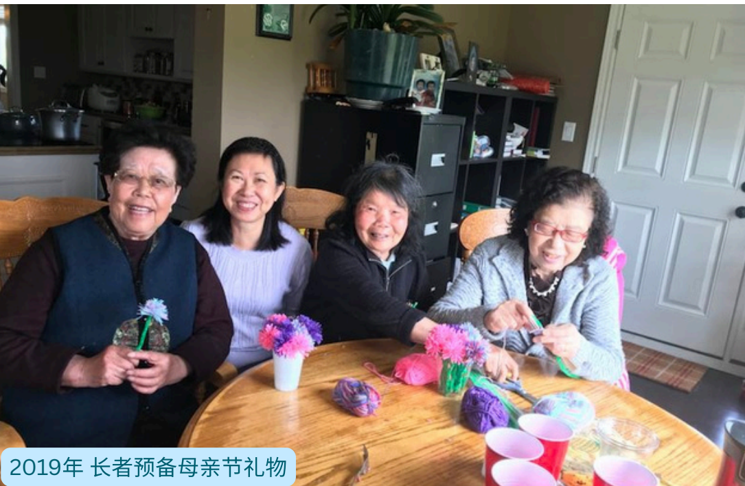
2019年 长者预备母亲节礼物