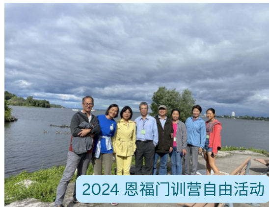
2024 恩福门训营自由活动