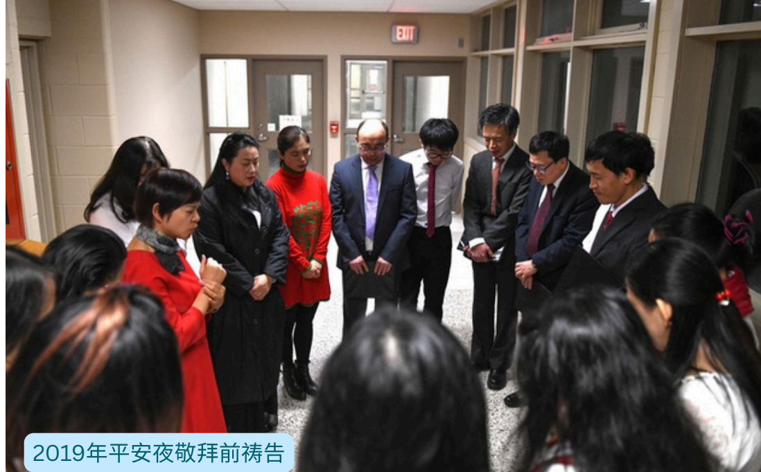
2019年平安夜敬拜前祷告