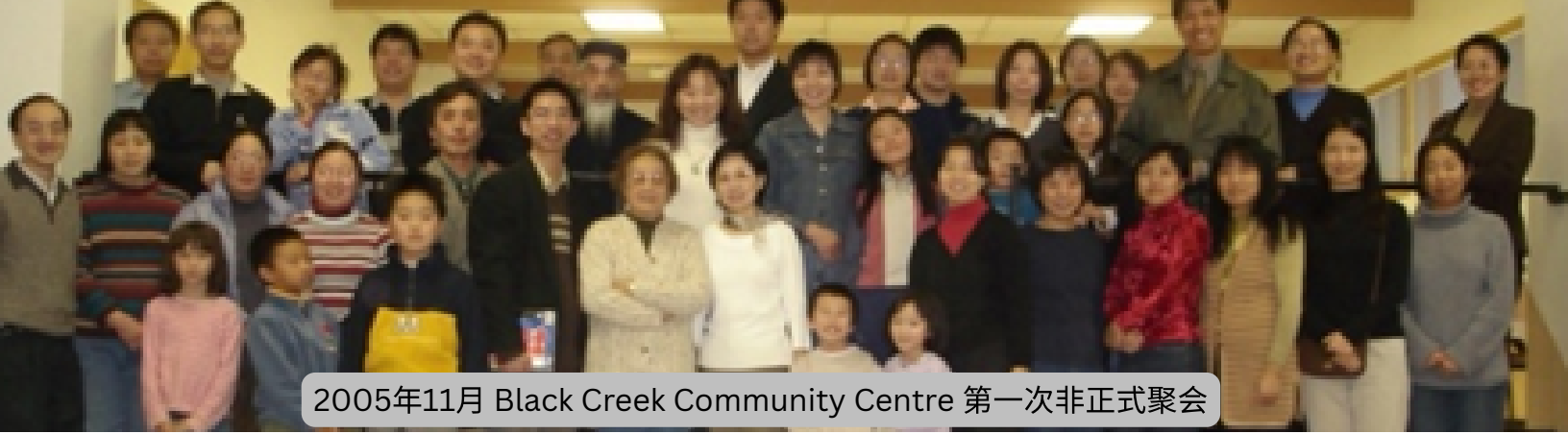
2005年11月 Black Creek Community Centre 第一次非正式聚会