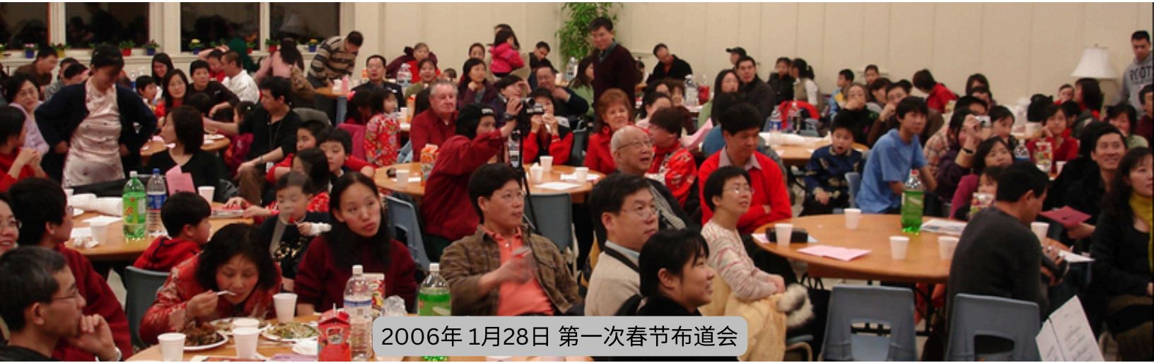
2006年 1月28日 第一次春节布道会