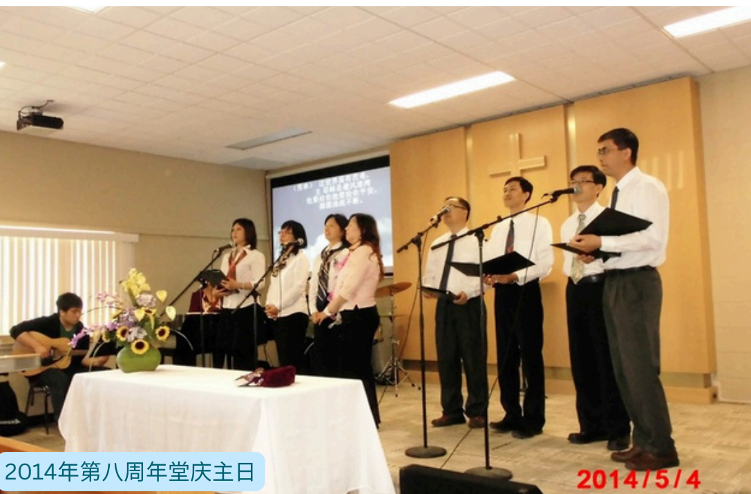
2014年第八周年堂庆主日