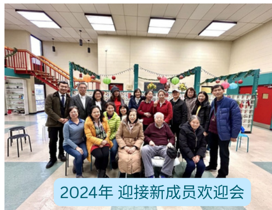
2024年 迎接新成员欢迎会