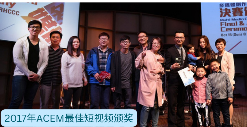
2017年ACEM最佳短视频颁奖