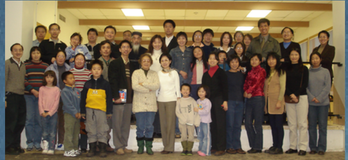
在 Black Creek Community Centre 举办了第一次非正式聚会