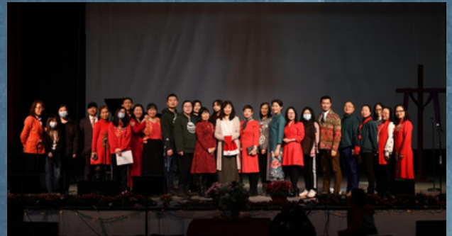
平安夜音乐特别敬拜