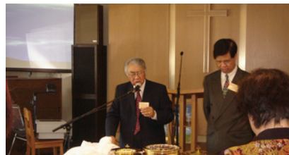
建堂主日：第一次圣餐