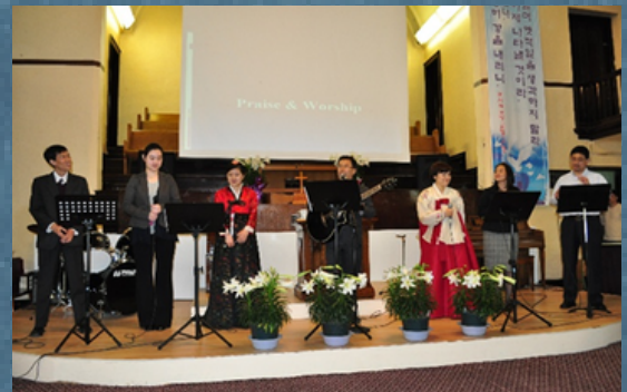
与韩国教会联会庆祝第五周年堂庆