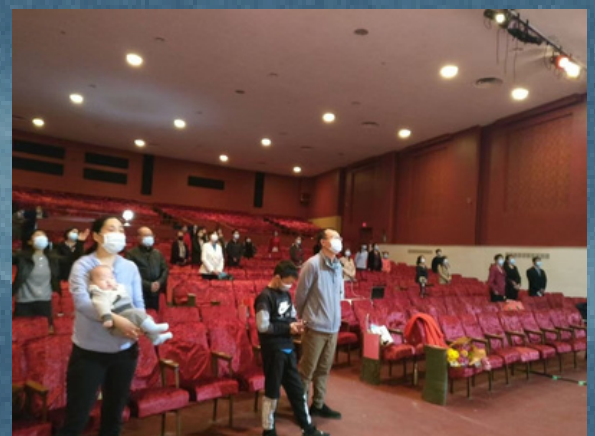
疫情后，恢复成人实体敬拜