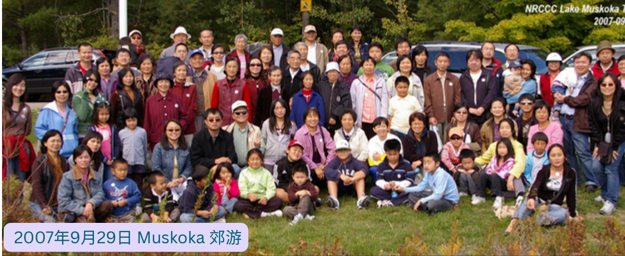
2007年9月29日 Muskoka 郊游