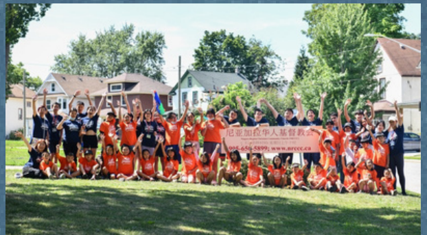
暑期儿童圣经夏令营

8月：暑期儿童圣经夏令营(VBS)，第一次全程由 Ambrose 传道带领以及青少年义工、成人义工负责举办