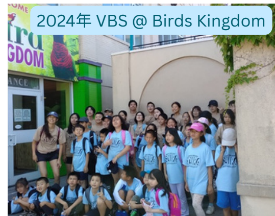
2024年 VBS @ Birds Kingdom