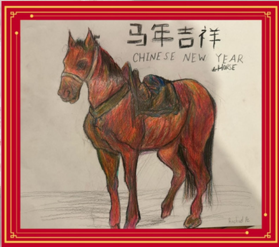
By Rachael Pei

因此，当我说“生日快乐，瀑布教会”时，这声祝福里浸透着个人的、无法衡量的感激。二十周年，对世界来说可能只是一段历史，但对我而言，它是一个在我生命最低谷时、给我安身之处的怀抱；是让我在彻底的失去中，依然能看见爱在行动；是让我在决堤的眼泪里，依然能寻见一丝盼望的光芒。