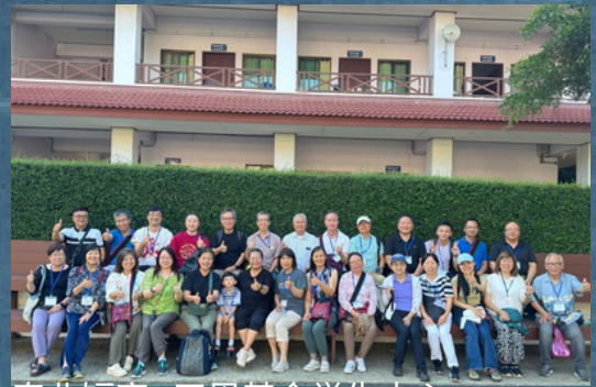
泰北短宣--天恩基金学生中心