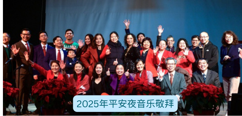
2025年平安夜音乐敬拜