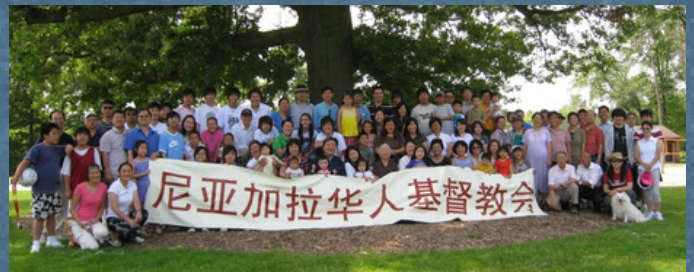
室外敬拜：Welland Chippawa park