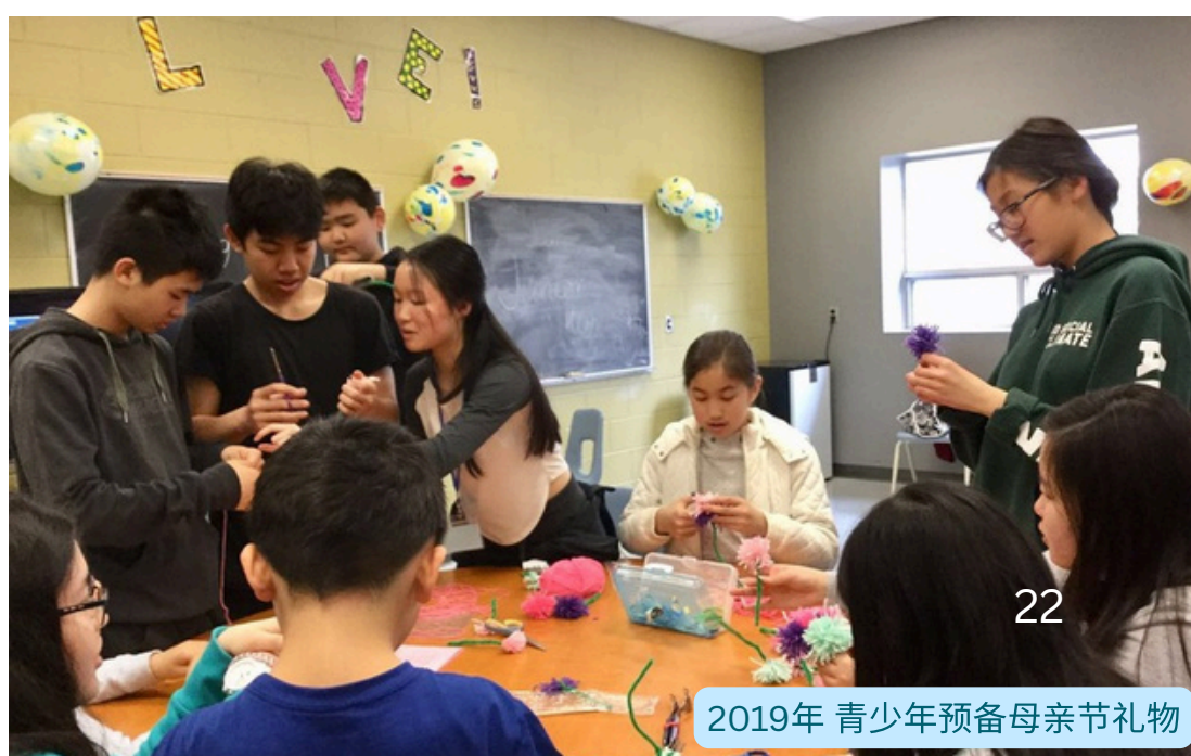
2019年 青少年预备母亲节礼物