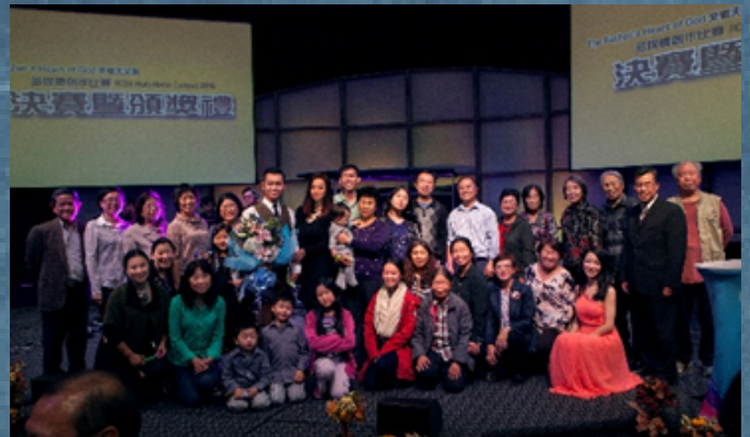
华基多媒体创作比赛颁奖仪式